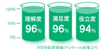
2009年度開催アンケート結果より

「キャリアデザイン講座」「入試対策講座」「キャンパスライフ紹介コーナー」「保護者対象講座」など