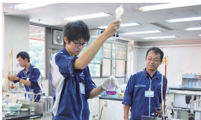
企業・行政等の多種多様な業種での教育プログラム

大学コンソーシアム京都の産学連携教育プログラム (2024年度より名称変更) は、就職活動や単なる就業体験ではなく、実体験と教育研究の融合による「学習意欲の喚起」「高い職業意識の育成」「自主性・独創性のある人材育成」を目的とした教育プログラムです。また、実践から「働く」を考え、社会人基礎力を育成するカリキュラムを持ったキャリア教育として、加盟校等から多くの学生が受講しています。