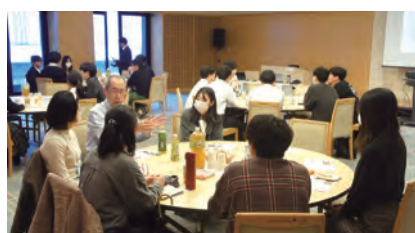
高大社連携フューチャーセッション