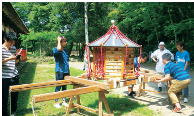
世界遺産を学びのフィールドとする「京都世界遺産PBL科目」

約50の加盟校はそれぞれが特色ある科目を開設しています。それら科目の一部は大学コンソーシアム京都と加盟校との協定に基づく単位互換制度により、他大学・短期大学の学生も受講することができ、ここで得た授業科目の単位は自校の単位として修得したものとみなされます。大学コンソーシアム京都では、前身の「京都・大学センター」が発足した1994年から本制度を運用しており、多くの学生が利用しています。2015年度からPBL (Project Based Learning) の学習手法を取り入れた「京都世界遺産PBL科目」を、2020年度からは「京都ミュージアムPBL科目」を開設し、京都ならではの科目を提供しています。