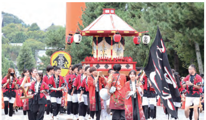
京都学生祭典本祭 京炎みこし

京都国際学生映画祭は、学生の実行委員会が運営する日本最大規模の国際学生映画祭です。実行委員会は、国内外を問わず、広く学生監督らの映画・映像作品をコンペ形式で募集・選考を行い、京都国際学生映画祭（2月開催）で上映することで、京都から若き才能の発掘と映画文化の発信、映画人材の国際交流を目指しています。大学コンソーシアム京都は、京都国際学生映画祭の主催者として、実行委員会の年間を通じた活動をサポートしています。