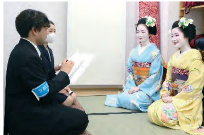
インタビュー風景

全国の中高校生に向けて、「大学のまち京都・学生のまち京都」の魅力を、ウェブサイト「コトカレ」やSNS等で発信しています。学生生活の他、京都ならではのイベントやアルバイト、京都にゆかりのある有名人インタビューなどの記事を紹介し、京都での学生生活の魅力を伝えています。