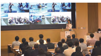
高大連携教育フォーラム

その他にも、高校生・大学生・社会人といった世代、学校間を超えた交流を目的とした高大社連携キャリア教育企画「高大社連携フューチャーセッション」や、学校や設置者の別を超えて各校の課題や悩みを共有し、解決に向けた交流を行う場としての「京都高校・大学職員交流会」、高大接続(入試・教育・高大連携等)を実現できる人材開発とネットワーク化を目的とした研修事業を実施しています。