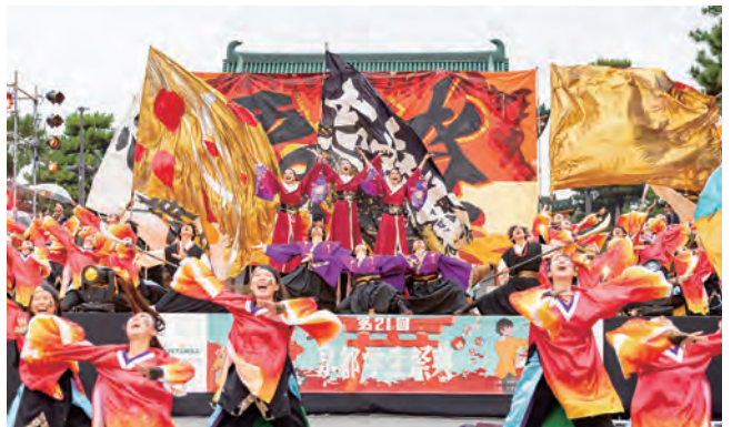
京都学生祭典本祭（平安神宮前ステージ）

京都学生祭典は、学生の力で京都を盛り上げようと2003年から毎年10月、平安神宮・岡崎公園一帯（京都市左京区）をステージに繰り広げられる一大イベントです。祭典は、京都の学生を中心に構成する実行委員会が企画・運営を行い、京都府、京都市、経済界、大学が「オール京都」体制でバックアップしています。実行委員会は、祭典のPRや地域との交流など年間を通して活動しており、大学コンソーシアム京都では、学びの場の提供など実行委員会の活動を支援しています。