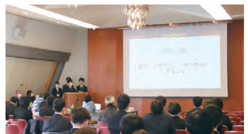
政策研究交流大会での学生による口頭発表

また、本大会の運営を行う学生実行委員会はインカレの活動として定着しており、より充実した大会とするため活動しています。