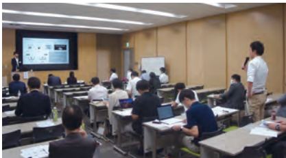
SDゼミナール「公開プレゼンテーション」

加盟校の大学職員を対象とした管理運営や教育・研究支援までを含めた資質向上のための様々な研修事業を展開しています。SD (Staff Development) 分野で関心の高まっているテーマを採り上げ、基調講演及び分科会における事例報告や意見交換を通じて、大学職員のスキル向上や大学の枠を超えた情報交流の場を提供することを目的とした「SDフォーラム」、大学職員の能力向上や基礎知識の獲得を目的とした「SD共同研修プログラム」、次世代の大学運営を担う職員の育成を目的とする「SDゼミナール」などを実施しています。