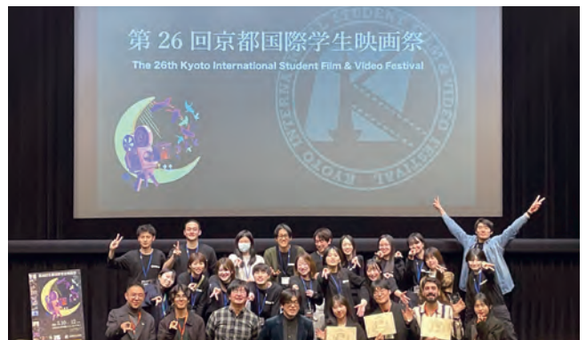
京都国際学生映画祭（京都文化博物館）

2016年4月に「障害者差別解消法」が施行され、大学では障がい学生支援担当者の能力向上や大学の枠を超えた情報共有が必要となっています。大学コンソーシアム京都は、そのネットワークの構築をめざして、「関西障がい学生支援担当者懇談会」を主催し、障がい学生支援担当者が意見交換を行える場を創出しています。また、「障がいのある学生への修学支援」をテーマとした研修会や、京都府内の高等学校と大学の教職員による懇談会を開催し、教育機関における障がい学生支援をサポートしています。