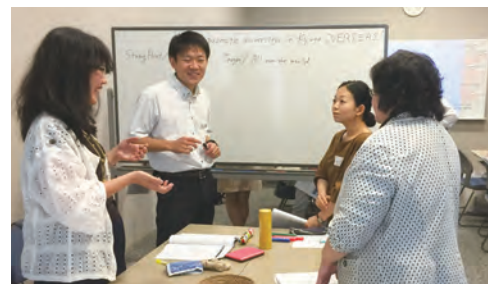
教職員スキルアップ研修

高等教育のグローバル化が加速する中、多くの国と地域からの留学生には、それぞれの文化的背景があり、円滑な意思疎通を図るためには、語学を超えて、習慣や社会通念、宗教等への理解も欠かせないものとなっています。このため、様々な場面を想定したケーススタディができる英語運用能力向上のための研修や英語圏以外の文化を学ぶ研修を実施することで、実務能力の底上げを行うとともに、スキルアップに対する意欲向上を図っています。