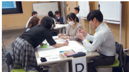
SD共同研修プログラム「ビジネスマナー研修」