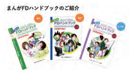
まんがFDハンドブック