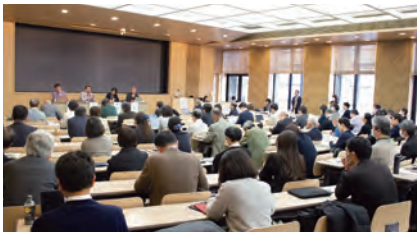
日本最大級のFDイベント「FDフォーラム」

教員が授業内容・方法を改善し向上させるための組織的な取組として、大学コンソーシアム京都では設立間もない1995年から加盟校と共に京都地域におけるFD (Faculty Development) 活動を推進しており、FD活動の普及、大学教育、授業改善に関する実践・研究報告及び人的交流の場の提供、京都におけるFD活動の情報発信を目的として「FDフォーラム」を開催しています。また、FD合同研修プログラムとして、加盟校の学長や副学長、部長レベルの大学執行部層を対象とした「大学執行部塾」、新任教員をはじめ、広く大学教員として必要な知識の獲得を目的とした「テーマ別研修」、加盟校の枠を超えて教職員が交流する機会を提供する「京都FD交流会」などを実施しています。