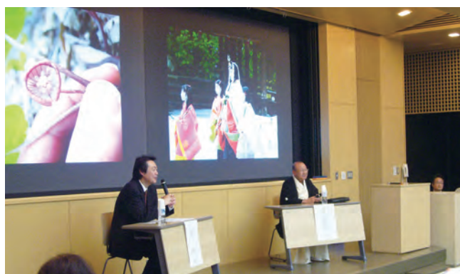
京都の様々なテーマを取り上げる「京都学講座」

大学の授業科目を市民に提供する「シティーカレッジ」を1997年に京都市と協力して開始し、その後2007年から「京(みやこ)カレッジ」と名称を変え、高度化・多様化する社会人の学習ニーズに応える生涯学習事業として実施しています。現在は、20年以上の歴史を持つ「京都学講座」をはじめ、加盟校により開講される特色ある授業や公開講座に毎年多くの市民が参加しています。2022年度からはリカレント教育プログラムの提供を開始しています。