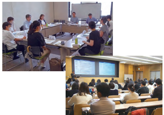
関西障がい学生支援担当者懇談会（キャンパスプラザ京都）