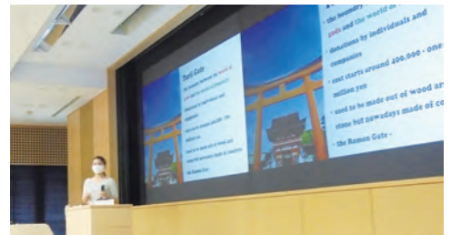
英語で京都をプレゼンテーション

日本人学生の海外留学促進に向け、無料の英語試験対策講座（IELTS、TOEFL iBT）を実施し、語学学習の支援に取り組んでいます。また、主に海外留学を検討する学生を対象に、京都や日本の伝統文化についての理解を深め、留学中あるいは留学後に京都を訪れている外国人に対して、京都や日本の魅力を英語で伝えることができるよう文化体験や留学生とのディスカッション等を交えて英語表現力やプレゼンテーション力を育むシリーズ講座として、「英語で京都をプレゼンテーション」を開講しています。